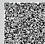
大学生实习岗位（一）

疫情影响未能返校的温籍大学生（所有春节期间未离开温州且14天内无流行病学史的健康人员）。如有意者，请将电子版的《实习实训报名登记表》于2月20日前发送至邮箱wz88308099@163.com，经审核通过的学生将会有专人联系。